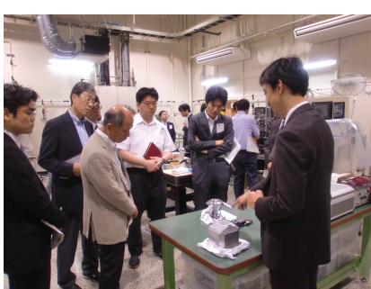
京都大学 桂キャンパス (2013. 5. 29)