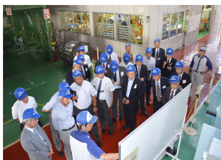
富士重工業 (株) 宇都宮製作所 (2013. 10. 9)

毎月の月例会の案内はSME 日本支部のホームページに公開されますので積極的な参加をお待ち申し上げます。また技術提供をいただける研究所や企業は是非SME 日本支部事務局に連絡いただきますようお願いいたします。